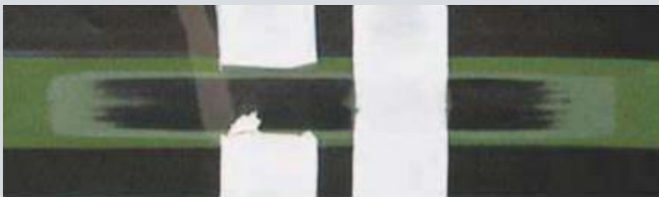
Mesmo após 2000 ciclos, o Sipomer® WAN II da Rhodia demonstra resistência à abrasão úmida excepcional;

SIPOMER PAM 100 ← Monômero funcional ← Aumenta a performance de resina acrílica em aderência e resistência corrosivo;